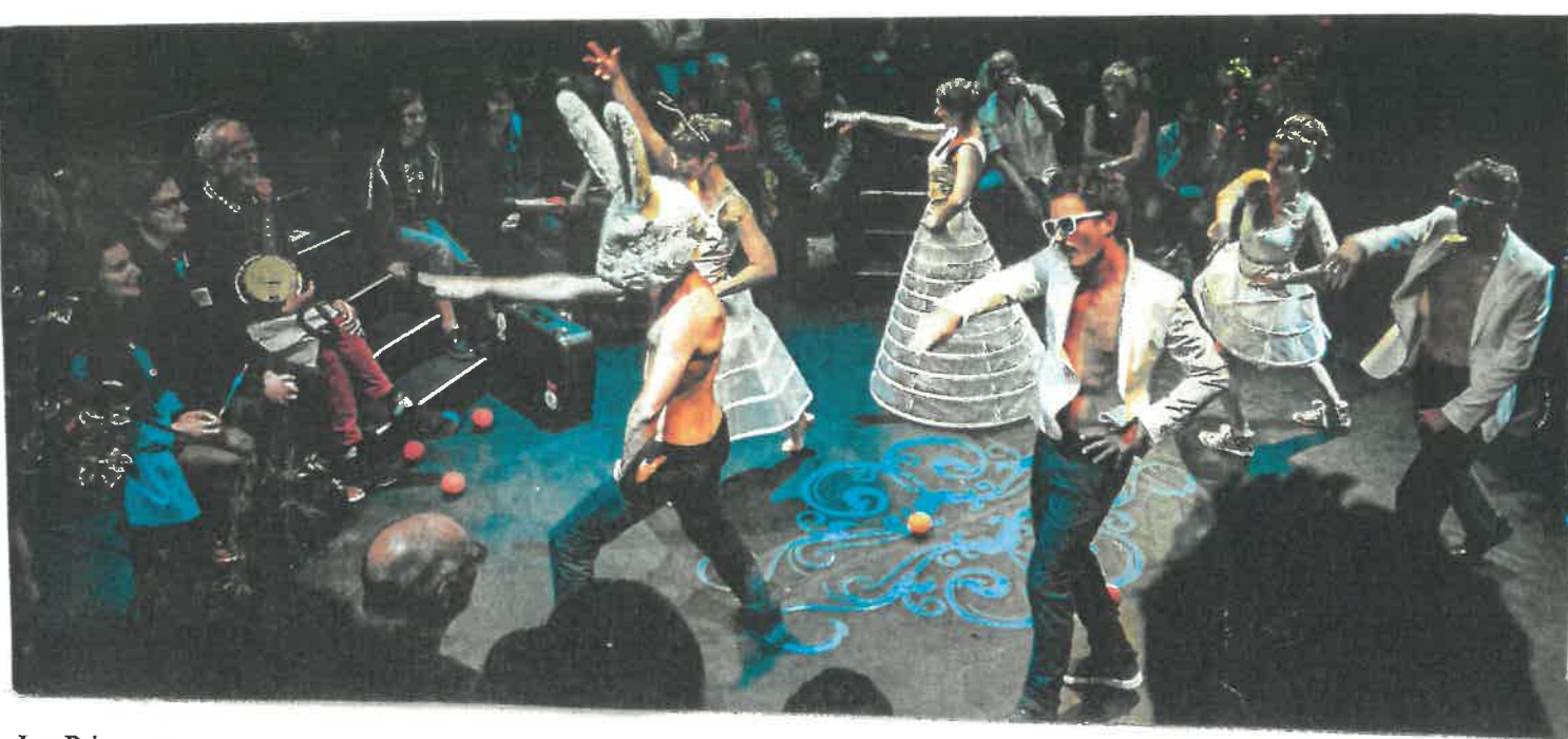
Les Princesses : Mercredi 13, Jeudi 14 et Vendredi 15 Février à 20h30 a eu lieu le spectacle époustouflant du Cheptel Aleïkoum, et ce, à guichet fermé. C'est donc 600 personnes qui ont fait vibrer la salle polyvalente d'AGNOS. Merci à la Communauté de Communes du Haut-Béarn d'avoir programmé un tel spectacle de qualité.