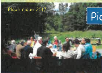
Pique nique 2017